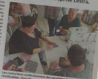
Les couturières confectionnent des serviettes hygiéniques réutilisables.

L'ashaj, qui accueille les cou- turières tous les jeudis après- midi, a financé l'achat du tissu PUL, qui permet aux serviettes d'être imperméables. Des en- treprises et associations sont également mobilisées pour diffuser l'information auprès des femmes : Val Touraine Ha- bitat, Touraine Logement, les Restos du cœur à Nazelles-